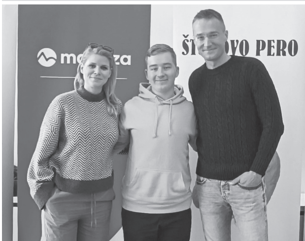
Mária Orság na Štúrovom pere