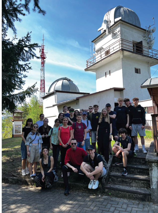
Duchovná obnova birmovancov v Badíne - 12. - 14. apríla 2024