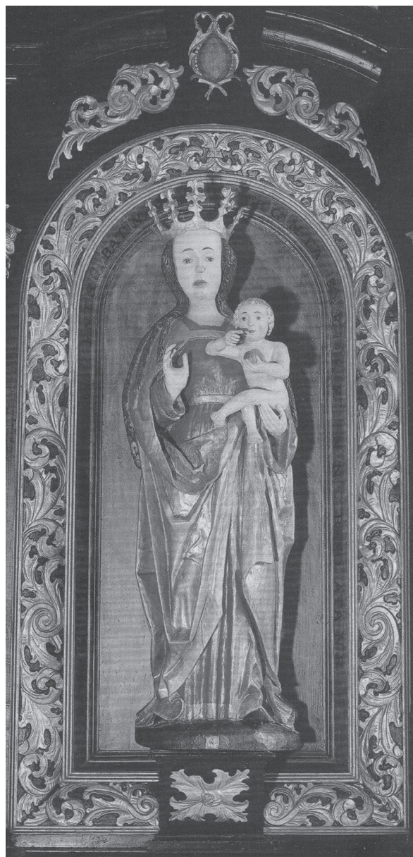
Socha Panny Márie z oltára Mariánskeho kostola.