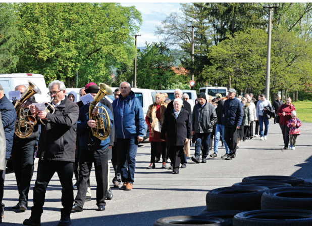
Necpalské hody - 21. apríla 2024