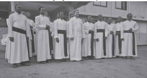
Seminaristi v Tanzánii