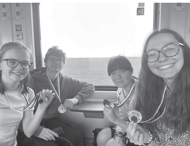
Úspešní účastníci francúzskej olympiády