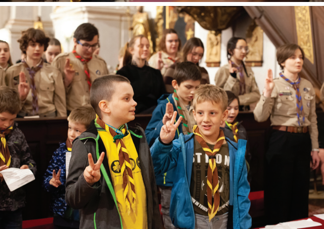
Sviatok sv. Juraja, patróna skautov, piaristický kostol v Prievidzi - 24. apríla 2024